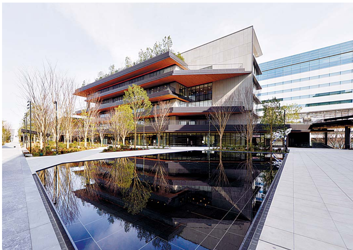
次世代型オフィス。各会社に専用使用できるテラスを完備。空と緑が心地よい環境で、健康的でクリエイティブな働き方を実現する