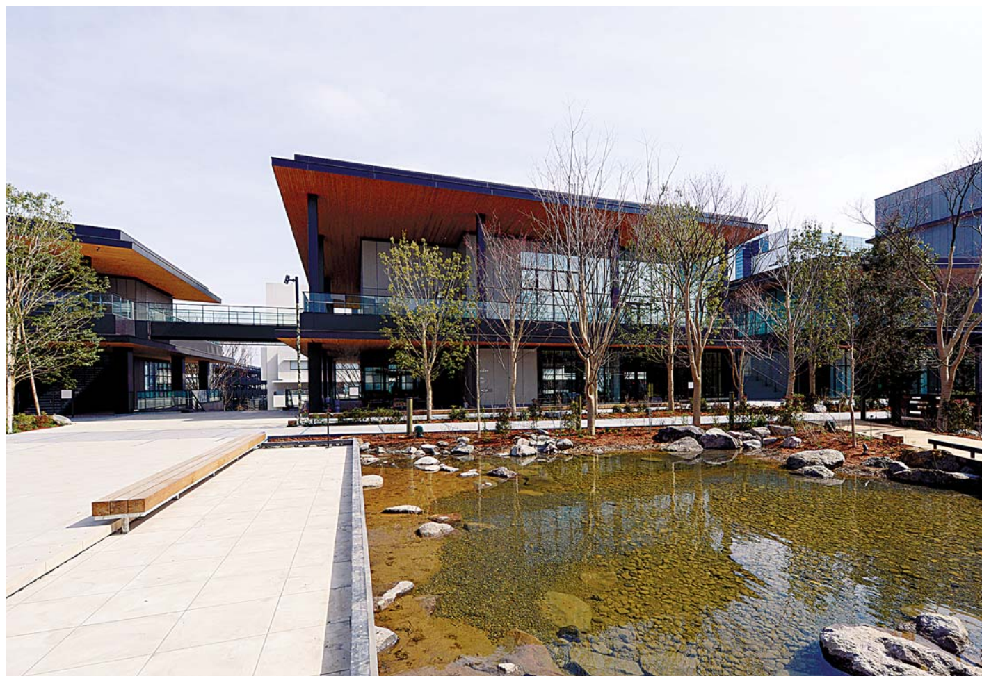
ショップ・レストラン。緑と水があふれる広場を中心とした、開放的なショッピング空間。まち歩きの楽しさと、心地よい体験を届ける