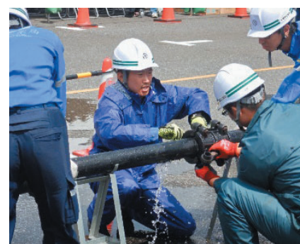
ライフライン施設応急復旧訓練

さらに今年度からは、令和元年の台風での経験を踏まえ、関係市との合同防災訓練を開催し、台風に備えたさらなる危機管理体制の強化を図っていきます。