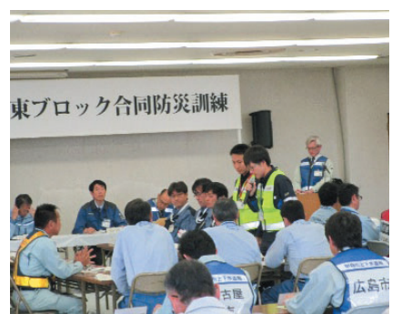
関東地方支部応急給水隊全体会議